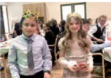
Tweens sitt juleball - s 11