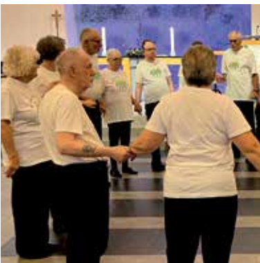
Spenstig jubilant - s 8