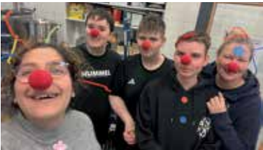
Karneval med «nye» fjes - s 7