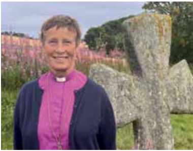
Storslått jubileumsfeiring - s 4-5

GLIMT FRA KOPERVIK MENIGHET NR 1 | 2025 32. ÅRGANG