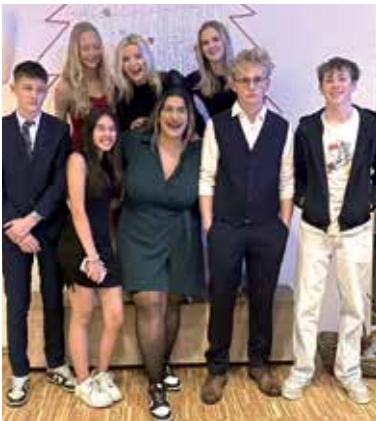
10-klassinger er medhjelpere - s 6