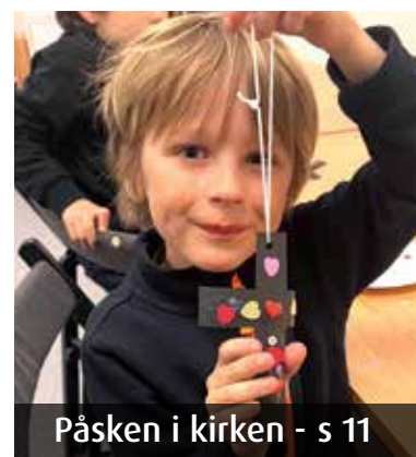
Påsken i kirken - s 11