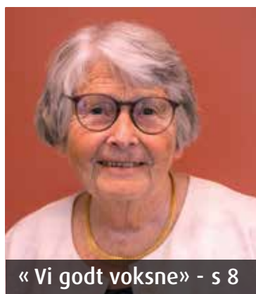
« Vi godt voksne » - s 8