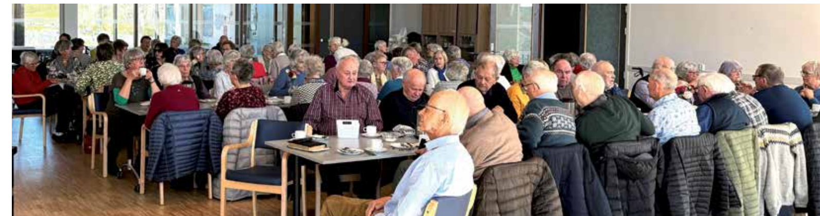
VI OVER 60 har stor oppslutning også i dag, her fra 24.04.24.