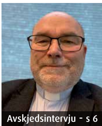
Avskjedsintervju - s 6