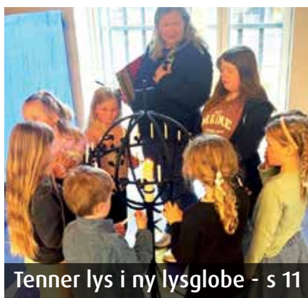
Tenner lys i ny lysglobe - s 11