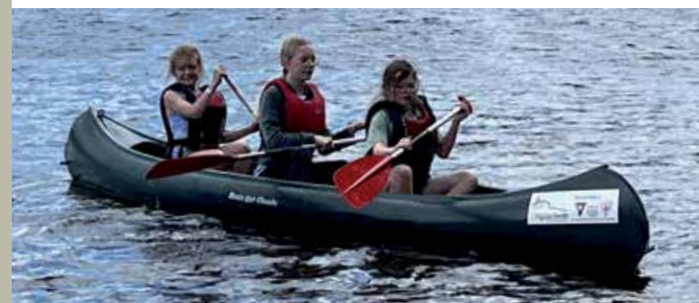
VIGNETTBIDET er denne gangen hentet fra Tweens-leiren på Vigdarheim. Se mer på side 9.

«Tro er å tro det vi ikke ser, og troens belønning er å se det vi tror», sa kirkefaderen Augustin.