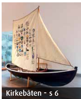
Kirkebåten - s 6