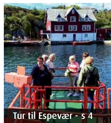
Tur til Espevær - s 4