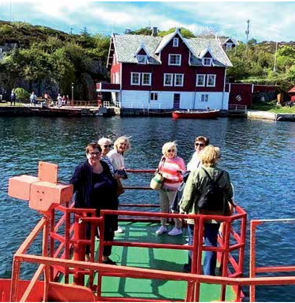
På kabelferje over sundet.