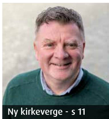
Ny kirkeverge - s 11