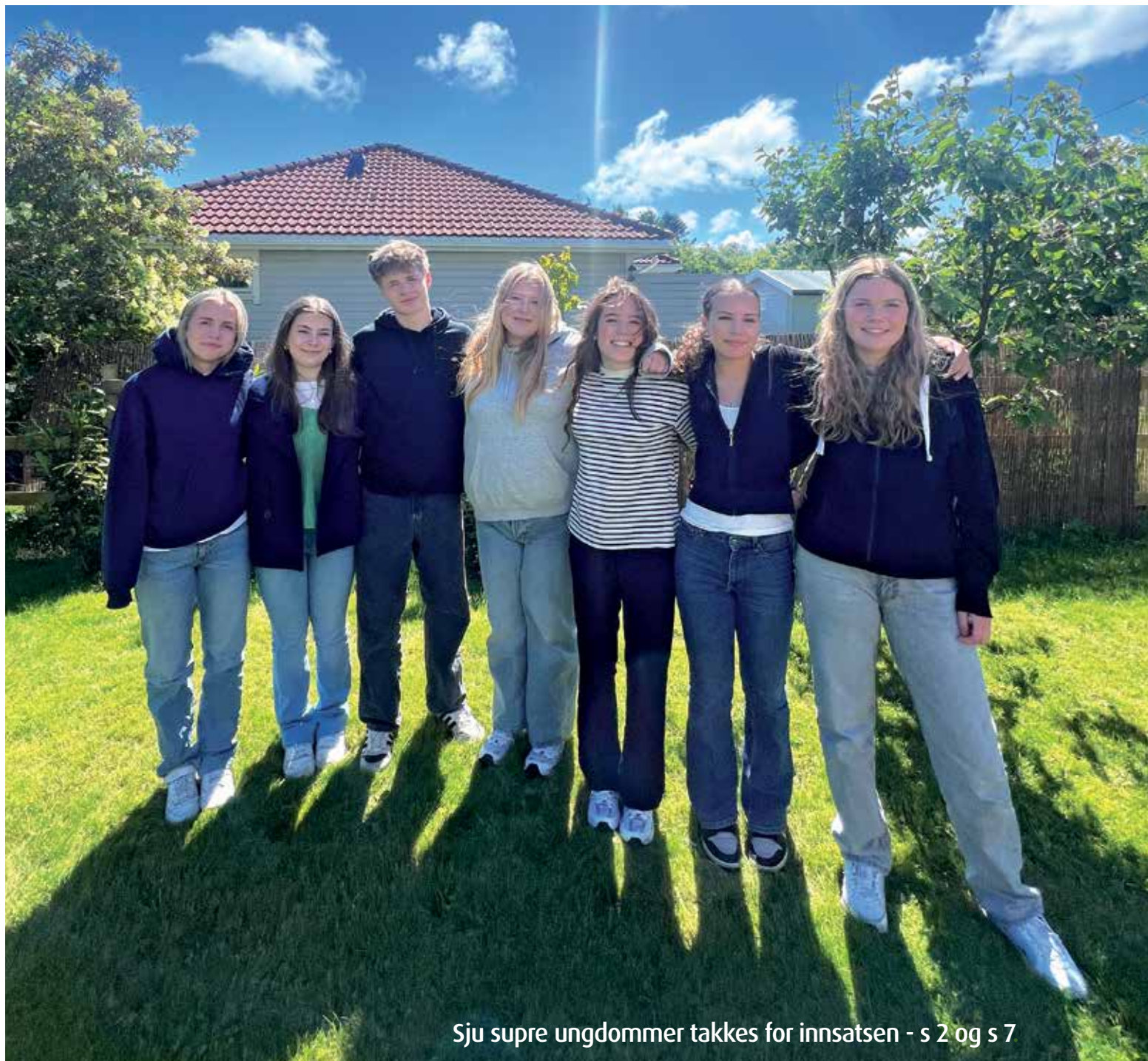
Sju supre ungdommer takkes for innsatsen - s 2 og s 7

GLIMT FRA KOPERVIK MENIGHET NR 3 | 2024 31. ÅRGANG