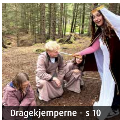
Dragekjemperne - s 10