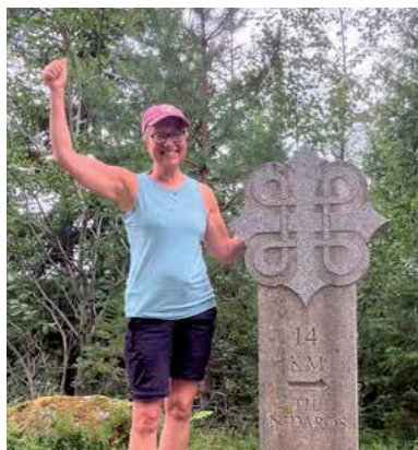
Målet er nådd! Se s. 4

GLIMT FRA KOPERVIK MENIGHET NR 3 | 2025 32. ÅRGANG