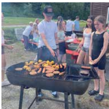
Sommerfest på Vigdarheim - s 6