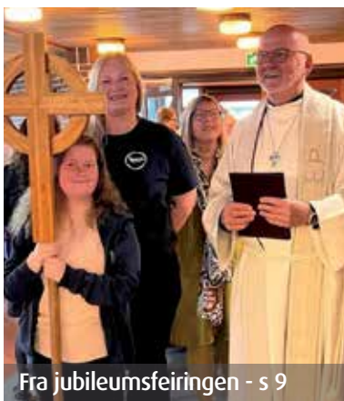
Fra jubileumsfeiringen - s 9