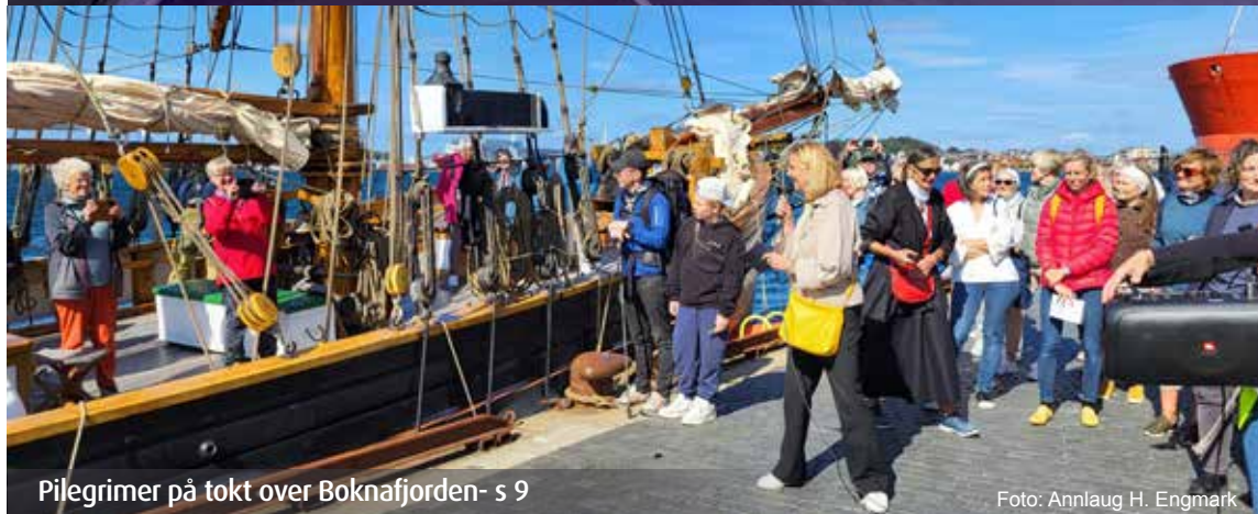
Pilegrimer på tokt over Boknafjorden- s 9