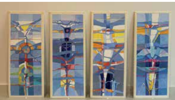
Utkast utarbeidet av Per Odd Aarrestad