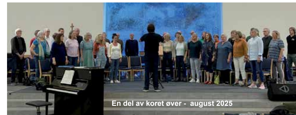
En del av koret øver - august 2025

I april 2023 framførte Norvegen prosjektkor Händels «Messias» i en fullsatt Kopervik kirke. Det ble en stor opplevelse. Nå er det Requiem i D-moll av Wolfgang Amadeus Mozart som står for tur, søndag 26. oktober - klokka 19.00, med kor, orkester og solister. Dette er et av musikkhistoriens store verk, og Mozarts siste. Mozart fikk verket i bestilling, men døde før han fikk fullført verket, og det ble ferdigstilt av hans elever, i hovedsak av Frans Xaver Süßmayr. Et rekviem er et musikalsk verk bygd over tekstene i den katolske messen for de døde. Ordet betyr «hvile» eller «ro» og er hentet fra innledningen av messen: «Requiem aeternam