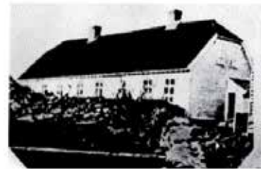
Kopervik skole ca. 1880 kulturlaget

Det er bygget til venstre (på bildet) som er den eldste, eksisterende delen av det som var legatskolen. Fløyen mot høyre ble bygd rundt 1900, av Kopervik kommune. Rommet i 2. etasje der var kommunestyresal og ble brukt som musikkrom. Slik så det ut rundt 1880.