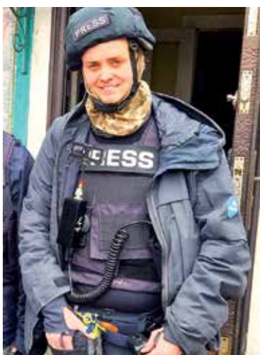
NRK-fotograf Gunnar Bratthammer i Ukraina og Gaza - s 8-9