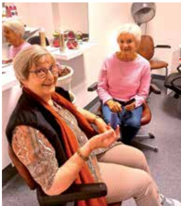
«Vi over 60» sitt frisørtilbud - s. 10