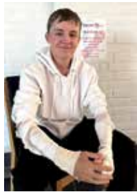
Konfirmant V. Ø..G. med bandasje på begge armene.

Så fikk femåringene sammen med foresatte myldre litt på stasjoner knyttet opp mot tema; øve seg på å legge bandasje, lage hjertepynt, pusle hjerter, be ved bønnestasjonen, tenne lys og tegne hjerter på livstreet. Vi avsluttet i kjelleren med kveldsmat og lek.