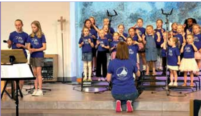
BARNEGOSPEL- KORET SANG PÅ HØSTBASAREN, SE S. 6-7