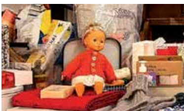
Basarer til glede og nytte - s 6-7, 10