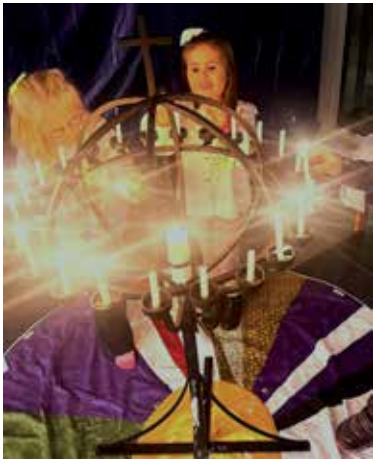
Dåpsklubb for 1. klassinger - s. 16

GLIMT FRA KOPERVIK MENIGHET NR 4 | 2024 31. ÅRGANG